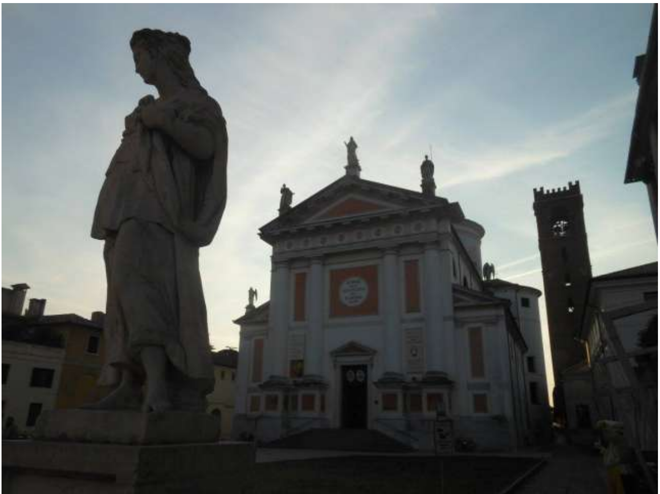
CASTELFRANCO VENETO - CITTADELLA (Facca):km 22

Castelfranco Veneto: B&B Pisolo -Piazza Europa unita n.19cell.3475853357-cell.3494775172(25€1pax,45€2 pax, 55 € 3 pax con colazione 5 € in più) veronesefrancesco61@libero.it