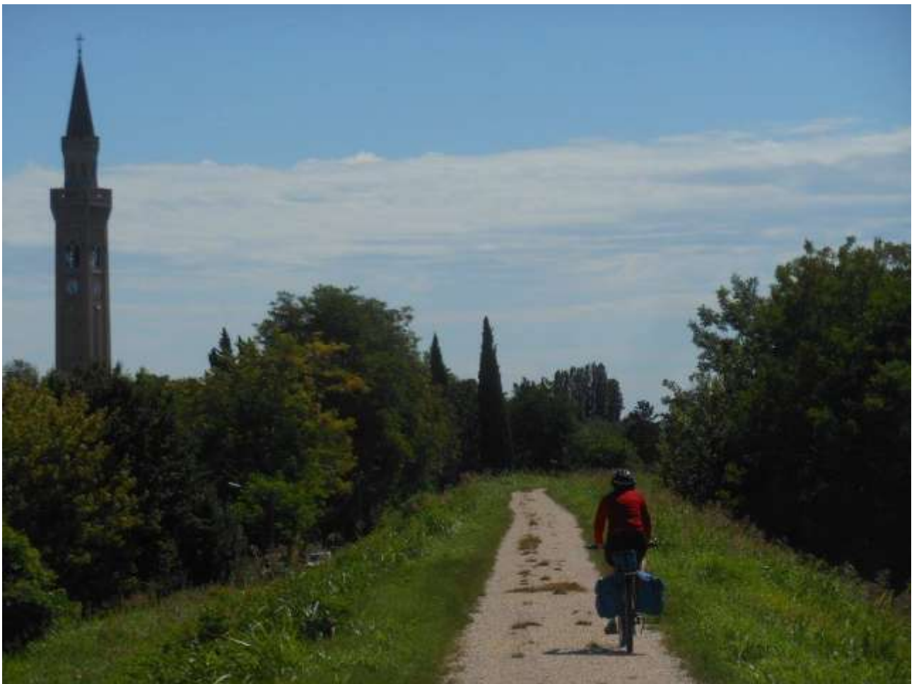
MUSILE DI PIAVE - CASALE SUL SILE:km 29

tel.0421182324(30€1pax,50€2pax, 60 € 3 pax con colazione) - villapace59@gmail.com